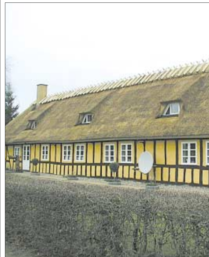
>> Stråtaget har dybe rødder i dansk byggeri som en både smidig, holdbar og smuk tagbelægning.

Det er otte år siden, han fik sit eget tækkfirma. I sit brød har han i dag to lærlinge - den ene bliver som en af de første herhjemme udlært