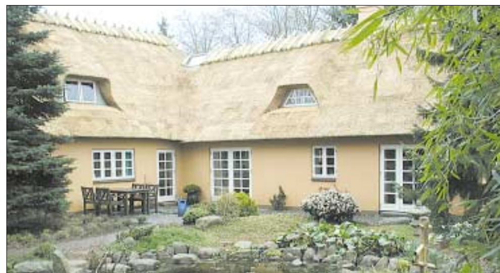
>> Et stråtag er både smukt, særpræget og miljøvenligt. Og på tagkonstruktioner med mange kviste er det prismæssigt konkurrencedygtigt med et tegltag.