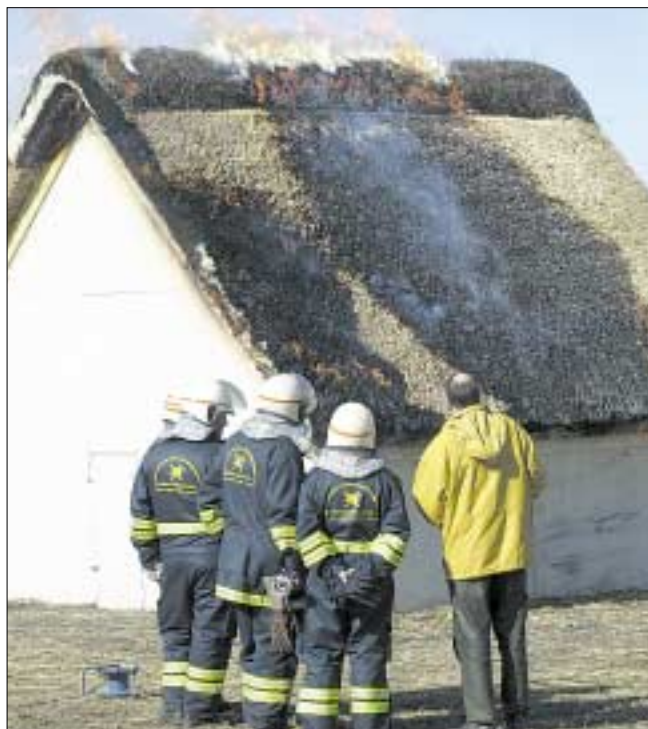
>> Ved forsøget med den nye brandsikring havde ilden efter 38 minutter endnu ikke gennembrændt glasvævsdugen. Både Dansk Brandteknisk Institut i København og Grenaa Brandvæsen deltog.

Forsøget viste også, at der ikke blev observeret flyvebrand, hvor brændende materiale er til fare for nærliggende bygninger. Det kan